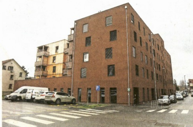
Knjižnica Polje v bližini večje koncentracije neprofitnih stanovanj je bila dokončana leta 2020.

V okviru postopkov za zbiranje pobud za izvedbeni del petega občinskega prostorskega načrta so na občini v sodelovanju s pristojnimi oddelki in MKL podali deset pobud za izboljšanje mreže ljubljanskih knjižnic.